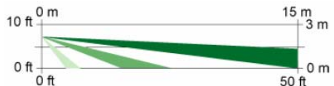
Vista lateral Cobertura de ancho estándar: 15 m x 15 m (50 pies x 50 pies)